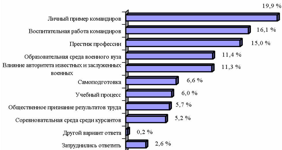
Рис. 3. Факторы, влияющие на становление курсантов истинными офицерами (в процентах от числа опрошенных, n = 909 )

Результаты проведенного исследования показали, что почти половина курсантов (46,4 %) собираются продолжать обучение, в то же время 8,9 %