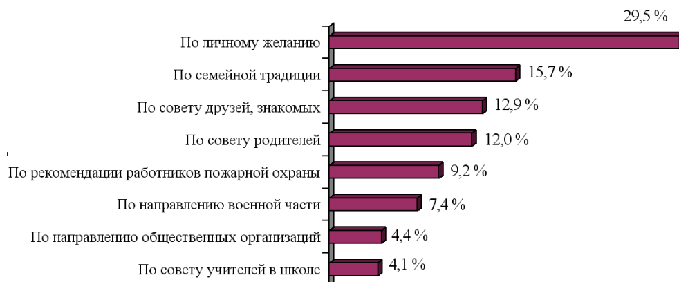
Рис. 1. Основные мотивы выбора профессии пожарного (в процентах от числа опрошенных, n = 909 )

мероприятий, способствующих ориентации молодежи на обучение специальностям ГПС МЧС России.